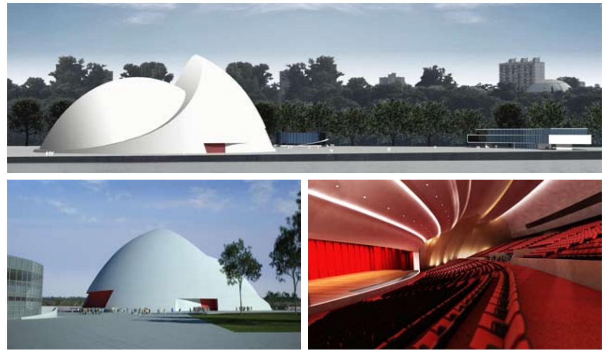
EL PUERTO DE LA MÚSICA, EN ROSARIO, TODAVÍA ESTÁ EN ETAPA DE PROYECTO. SU CONSTRUCCIÓN BUSCA POTENCIAR LA VIDA CULTURAL DE LA CIUDAD ARGENTINA.